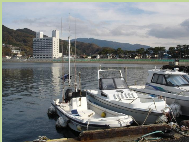
松崎漁港から伊東園ホテルを望む